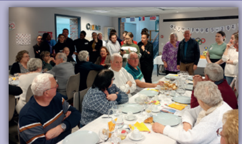
Le Blind test du 24 avril remporté par la table du maire avec une mention spéciale aux élèves de la MFR qui ont assuré la cuisine et le service

■ Contact : Martine Berthelin martine.berthelin@orange.fr - 06 63 09 22 68